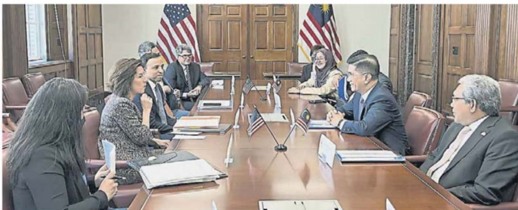
阿兹敏阿里 (右二) 与吉娜雷蒙多 (左二) 举行双边会谈，并签署一份保障供应链弹性的合作备忘录。

阿兹敏说，该部将继续贸易访问吸引更多投资，而高质量投资将为我国人才打造更多就业机会。